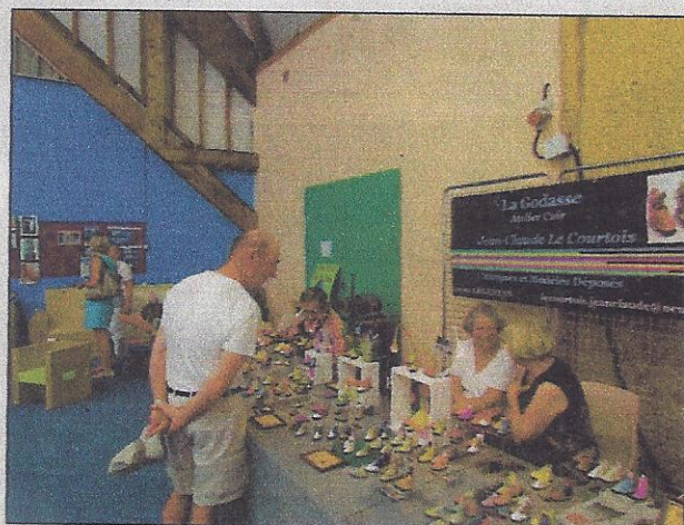
Désirez-vous une paire de godasses fantaisie ?